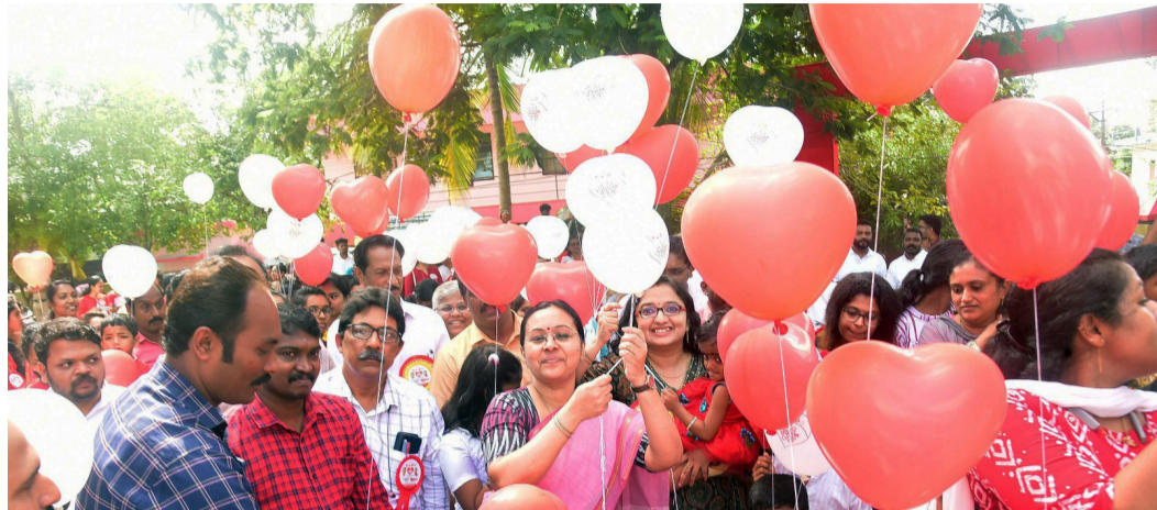
ഹൃദൃം ഗുണഭോക്തൃ സംഗമത്തിൽ കുട്ടികളോടും രക്ഷിതാക്കളോടുംമാപ്പം ആരോഗ്യ വകുപ്പ് മന്ത്രി വീണാ ജോർജ്ജ്

പത്തനംതിട്ട: ഹൃദൃം പദ്ധതിയിലൂടെ ഇതുവരെ 6204 കുട്ടികൾക്ക് ഹൃദയശസ്ത്രക്രിയ നടത്തിയിട്ടുണ്ടെന്ന് ആരോഗ്യ വകുപ്പ് മന്ത്രി വീണാ ജോർജ്ജ് പറഞ്ഞു. പത്തനംതിട്ട ജില്ലയിലെ ഹൃദൃം പദ്ധതി ഗുണഭോക്താക്കളായ കുട്ടികളുടെയും രക്ഷകർത്താക്കളുടെയും സംഗമ പരിപാടിയായ 'ഹൃദയമാണ് ഹൃദൃം' കോഴഞ്ചേരി സെന്റ് തോമസ് മാർത്തോമ്മാ ചർച്ച് ഓഡിറ്റോറിയത്തിൽ ഉദ്ഘാടനം ചെയ്തു സംസാരിക്കുകയായിരുന്നു മന്ത്രി. സംസ്ഥാനത്ത് ആകെ 18,259 പേരാണ് ഹൃദൃം പദ്ധതിയിൽ രജിസ്റ്റർ ചെയ്തിട്ടുള്ളത്. അവയിൽ 6,204 സർജിക്കൽ നടന്നു കഴിഞ്ഞു. ജില്ലയിൽ 561 കുട്ടികളാണ് രജിസ്റ്റർ ചെയ്തിട്ടുള്ളത്. 149 പേർക്ക് ഇതുവരെ സർജി ചെയ്തു കഴിഞ്ഞു. സംസ്ഥാന സർക്കാരിന്റെ ഏറ്റവും പ്രധാനപ്പെട്ട പദ്ധതികളിൽ ഒന്നാണ് ഹൃദൃം. ജന്മനാ ഹൃദ്രോഗമുള്ള കുട്ടികളുടെ അതിജീവന നിരക്ക് മെച്ചപ്പെടുത്തുന്നതിൽ വലിയ പങ്കാണ് ഹൃദൃം പദ്ധതി നിർവഹിക്കുന്നത്. ഒരു കുട്ടിയേയും സർക്കാർ കൈവിടില്ല. പദ്ധതി കൂടുതൽ ആശുപത്രിയിലേക്ക് എം പാനൽ ചെയ്യും. ഒരു കുട്ടി പോലും ചികിത്സ കിട്ടാതെ വിഷമിക്കുന്നില്ലെന്ന് ഉറപ്പാക്കും. എല്ലാ കുട്ടികൾക്കും അവരുടെ സാമൂഹിക - സാമ്പത്തിക പശ്ചാത്തലം പരിഗണിക്കാതെ