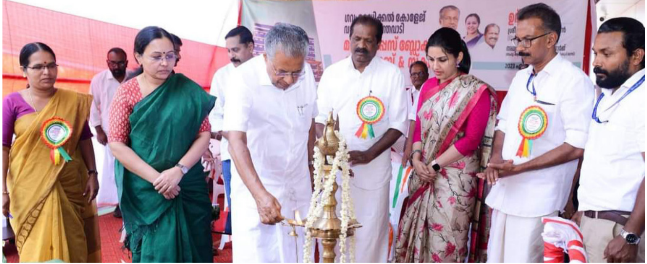
മാനന്തവാടി ഗവ. മെഡിക്കൽ കോളജിലെ മൾട്ടി പർപ്പസ് കെട്ടിട സമുച്ചയം മുഖ്യമന്ത്രി പിണറായി വിജയൻ ഉദ്ഘാടനം ചെയ്യുന്നു. ആരോഗ്യവും വനിതാ-ശിശുവികസനവും വകുപ്പ് മന്ത്രി വീണാ ജോർജ്ജ് സമീപം (ഫയൽ ചിത്രം)

കൽപ്പറ്റ: സമസ്ത മേഖലകളിലും വയനാട് 'ആരോഗ്യത്തോടെ' മുന്നേറുകയാണ്. 2016നു ശേഷം വൻ മുന്നേറ്റമാണ് വയനാടിന്റെ ആരോഗ്യം നേടിയത്. കനിവ് (108) ആംബുലൻസ് 11 എണ്ണം ജില്ലയിൽ അനുവദിച്ചു. ട്രൈബൽ മേഖലയിലെ ആരോഗ്യ പ്രശ്നങ്ങൾ കണ്ടെത്തുന്നതിനും പരിഹരിക്കുന്നതിനും അവർക്കിടയിൽ തന്നെ